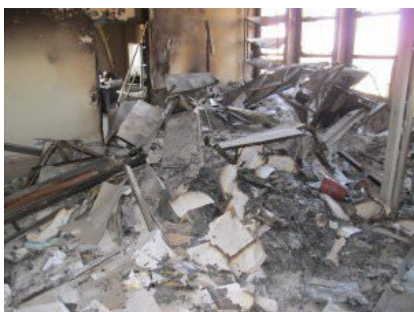
Здание Дворца правосудия (суда) в городе Хама, сожженное "мирными демонстрантами"...