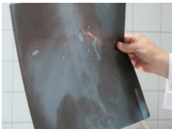
Рентген тела сирийского солдата с многочисленными осколками от самодельной бомбы "мирных демонстрантов", включая части гвоздей