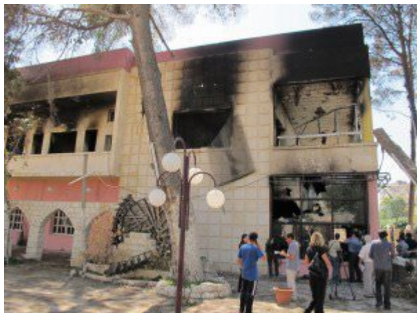
Сожженное "мирными демонстрантами" здание банкетного зала Клуба офицеров в городе Хама.