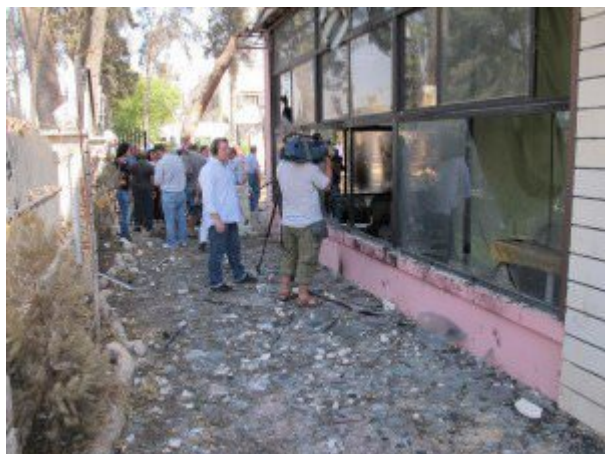
Тот же Клуб офицеров в Хаме...